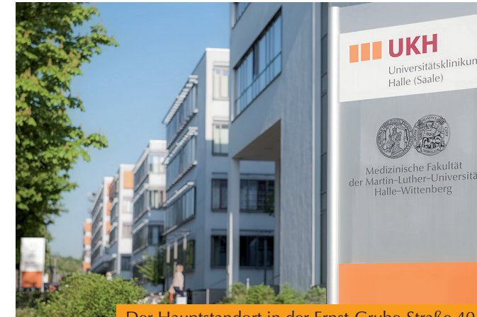
Der Hauptstandort in der Ernst-Grube-Straße 40