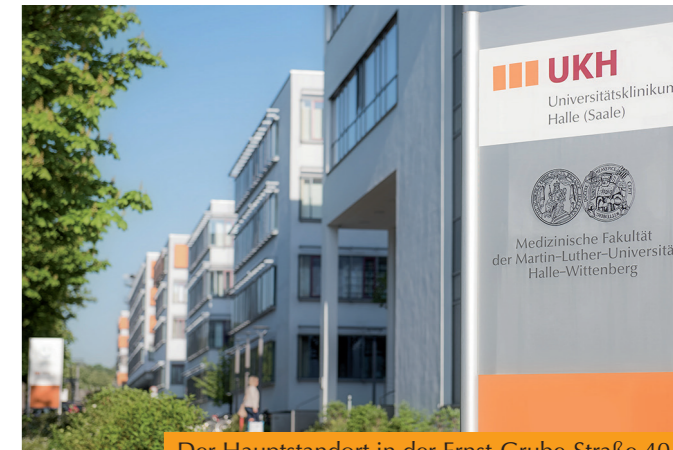
Der Hauptstandort in der Ernst-Grube-Straße 40